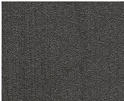
kunstschmiedeschwarz durch Bürsten auf Eisenglanz aufgehellt

wrought-iron black mat is easily brushable to iron gloss.