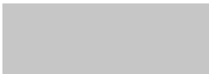
silbergrau / silver grey 106* (DB 704)